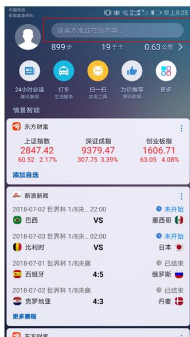
智能助手顶部入口