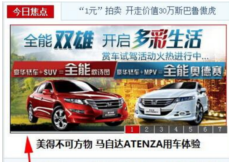
(图 1：素材四周有留白，不符合素材规定)

7.6 素材不要出现无意义符号、无意义线框、保持素材整体布局美观、文字有设计感； 举例说明：