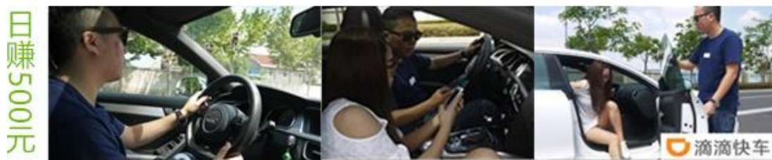
(图 1：素材中使用三张毫无设计感的图片直接拼接，不符合规定)