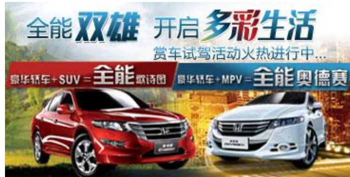
(图1：元素比例拉高，属于与事实不符的图)