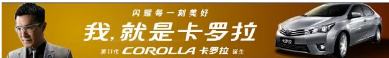
(图2：元素均清晰，为标准素材)

7.5 素材边框内画面要填满，不可留白。此情况发生于素材制作时，模板尺寸正确，但图片剪裁时缺少像素，导致素材完稿四周有留白；