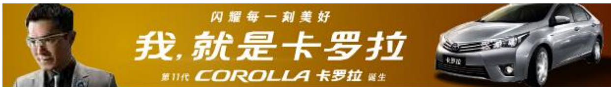
(图1：部分元素模糊不清，不符合素材清晰度要求)