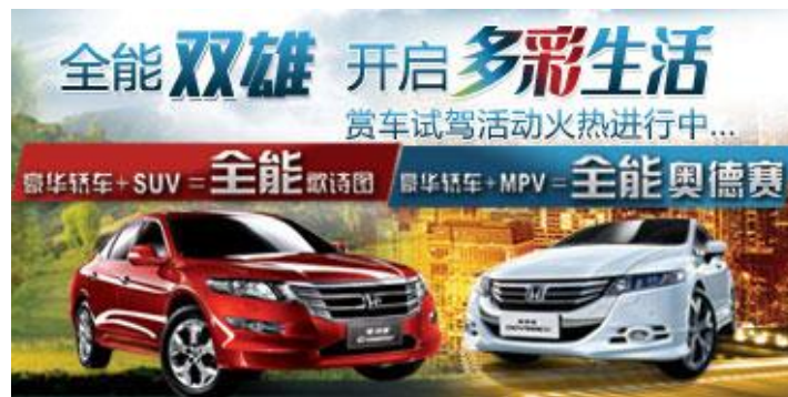
(图2：原始比例，属于标准素材图)